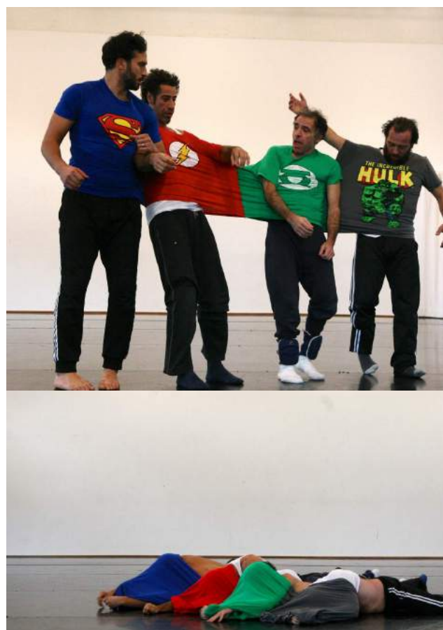
Photos issues du 1er laboratoire à la Briqueterie – CDCN du Val de Marne – Vitry-sur-Seine – octobre 18